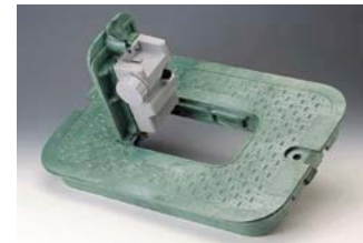
Tampa VB1419U com painel de acesso para montar caixa de comando TBOS™